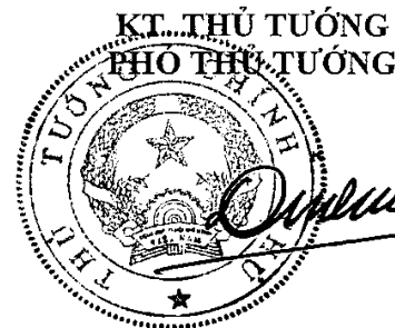
Vương Đình Huệ